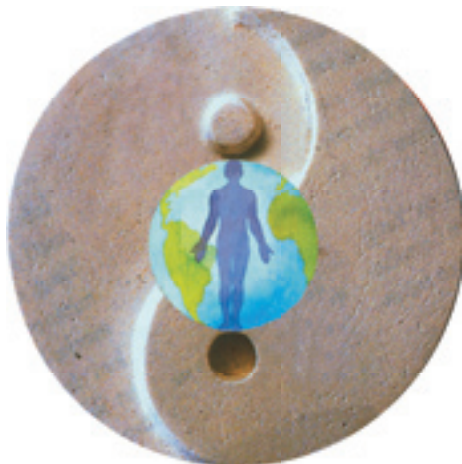
Balanse - sunnhetens grunnregel

Utdrag fra Julia Völdans hefte: Pluss-minus-balansen: Muligens selve nøkkelen til sunnhet ISBN 87 85 154121